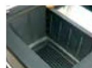
Chambre de combustion fonte d'acier

Sortie de fumée par l'arrière et le dessus, hauteur axe sol 680mm Cuisinière non encastrable