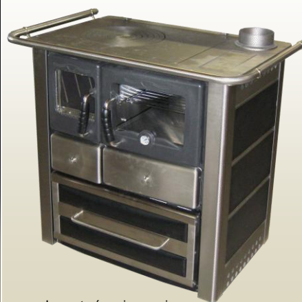
Inox et céramique noir